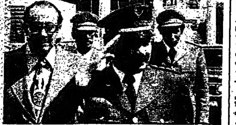
المقيد لشرف رئيس الوفد العسكري الجزائري لدى وصوله إلى القصر الجمهوري مع الوفد امس ، برفقة السفير الجزائري السيد محمد يزيد

استقبل الرئيس سليمان فرنجية في الساعات الواحدة بجمع ظهر امس ، الوفد العسكري الجزائري الذي يقود لثمان رسما برئاسة المقيد لشرف ورافق الوفد سفير الجزائر في لبنان السيد محمد يزيد . وقد حضر القابلة رئيس الحكومة رشيد المصلح . وبعد الاجتماع الذي استغرق حوالي ساعة ، دعا الرئيس فرنجية اعضاء الوفد لتناول الغداء السيي ملائمة ، كما دعي للغداء ايضا ، وزير الدفاع السيد جوزف سكاف ، والعماد اسكندر ققم ، والعماد نصرالله رئيس الأركان وعدد من كبار الضباط . وقال سفير الجزائر السيد محمد يزيد ، ان المباحثات التي تجريها اللجنة الجزائرية مع المسؤولين الفرنسيين تتناول تنفيذ مقررات مؤتمر وهران القاهرة . جنيلاط يقوم بزيارة خاصة إلى أوروبا يسافر السيد كمال جنيلاط بعد ظهر الجمعة المقبل إلى أوروبا ، في زيارة خاصة لها علاقة بمشروع جعل « سبيل » - ومن المقرر ، ان يعود إلى بيروت يوم الأربعاء أو الخميس المقبل .